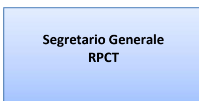
Figura 2- Organizzazione interna della prevenzione della corruzione